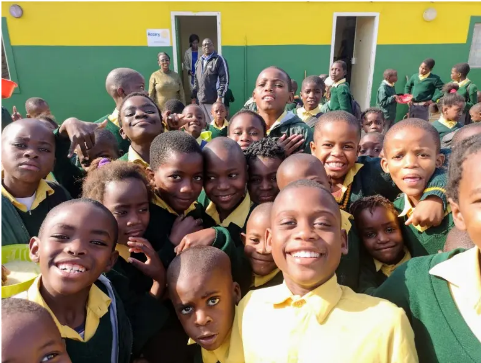
Schüler in Swakopmund in Namibia.

Mit dem Projekt belegte man kürzlich bei der Vergabe für den Preis African Responsible Tourism Award sogar den zweiten Platz. Diese Auszeichnung würdigt Organisationen, die eine beispielhafte touristische Vorbildfunktion einnehmen und aufzeigen, wie Tourismus die Einheimischen unterstützen kann.